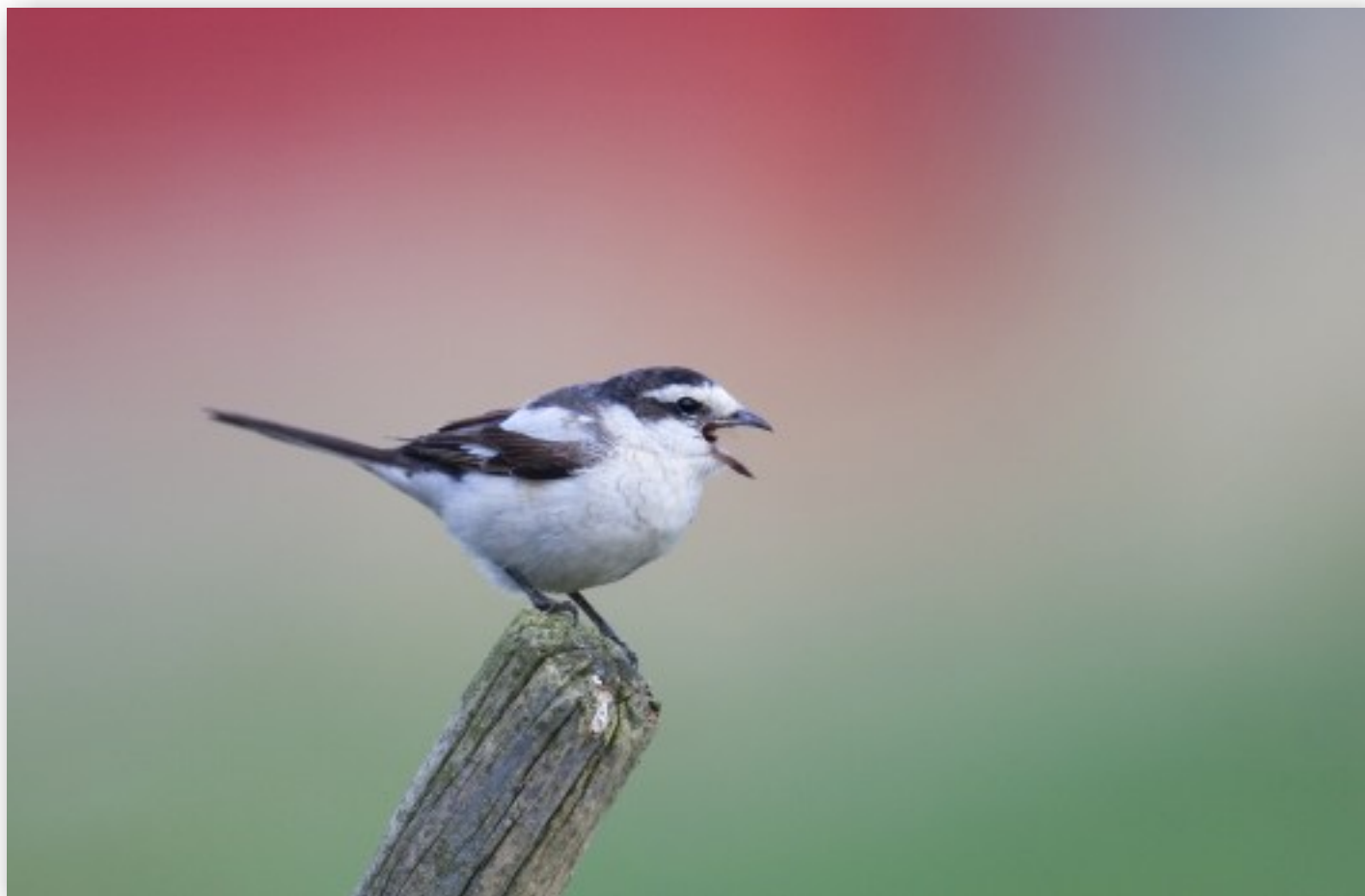
Nok en gullvarsler på Sira!

I begynnelsen av oktober 2006 hadde rekordmange fuglefolk inntatt den sagnomsuste bombeøya Utsira. Med 23 olagull på merittlisten hvorav to i 2005 håpet alle at det ville skje igjen.